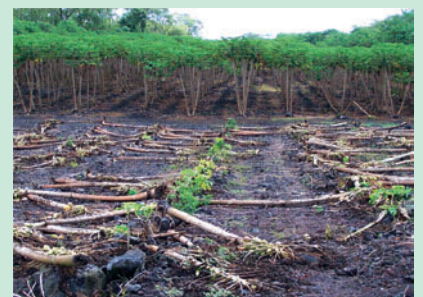
手前はPRSVに冒されて切り倒された非遺伝子組換えパパイヤの畑。奥はパパイヤ55-1の畑。

これらは遺伝子組換えパパイヤの混入がないように、ハワイ州政府により確認された登録農場で隔離栽培、分別管理・流通され、更に、包装施設において分別管理、ロット検査を行い、州政府による分別管理の証明書が添付されたものが輸入されています。