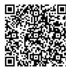
「食品の安全を守るしくみ」

食品安全委員会の詳しい役割は、過去のキッズボックス「食品の安全を守るしくみ」をみてね。