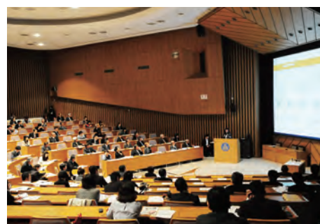
国際セミナーの様子