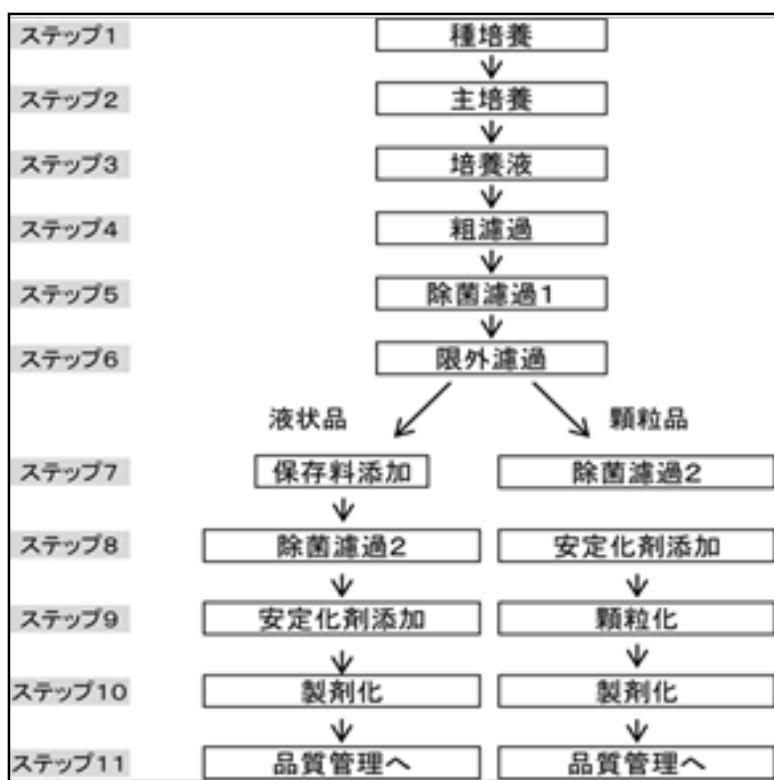
図2 アスパラギナーゼ製造方法の概略

また、最終製品には液状品と顆粒品の2種類があり、いずれも全有機固形物(TOS)は4% (w/w) であるとされている。また、評価に供した試験成績の主な被験物質であるバッチ PPV24743 は、最終製品の製造過程の途中(図2におけるステップ5の後)で濃縮を行ったものであり、保存剤、安定化剤を含まない。バッチ PPV24743 の TOS は 8.4% であるとされている。(参照2、7、8、9)