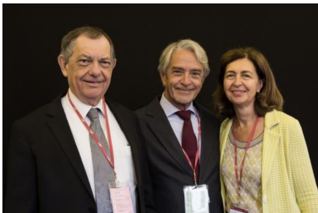
(左から、ヴァラ OIE 事務局長、ティアマン コード委員会議長、エロワ新事務局長)