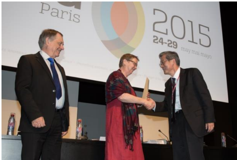
(授証式の様子 (左からヴァラ OIE 事務局長、シュヴァンバウアー総会議長、川島審議官))

術総合研究機構動物衛生研究所である。今後、FAOとOIEの両機関による正式な手続を経て6月中に認定される見込み。