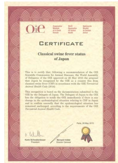
(ステータス認定証)