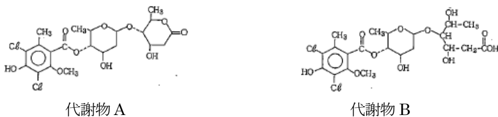
図 2 代謝物 A 及び B の構造式