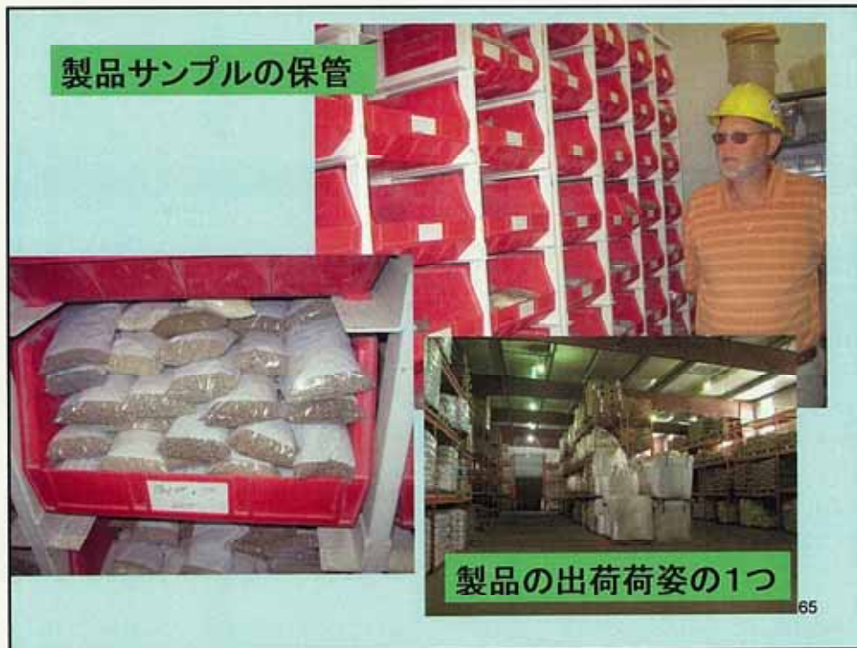
製品サンプルの保管