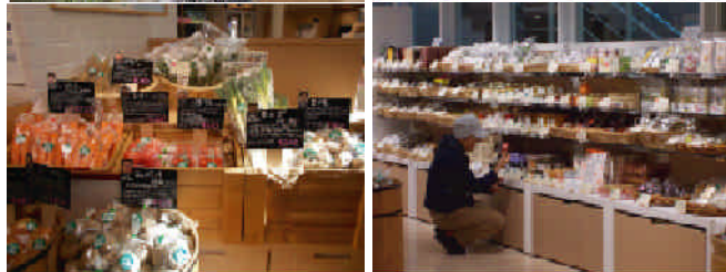
野菜・果物・米・加工品・日本酒・伝統工芸品など240品目を販売。商品を実際に調理して試食できるコーナーも設置。