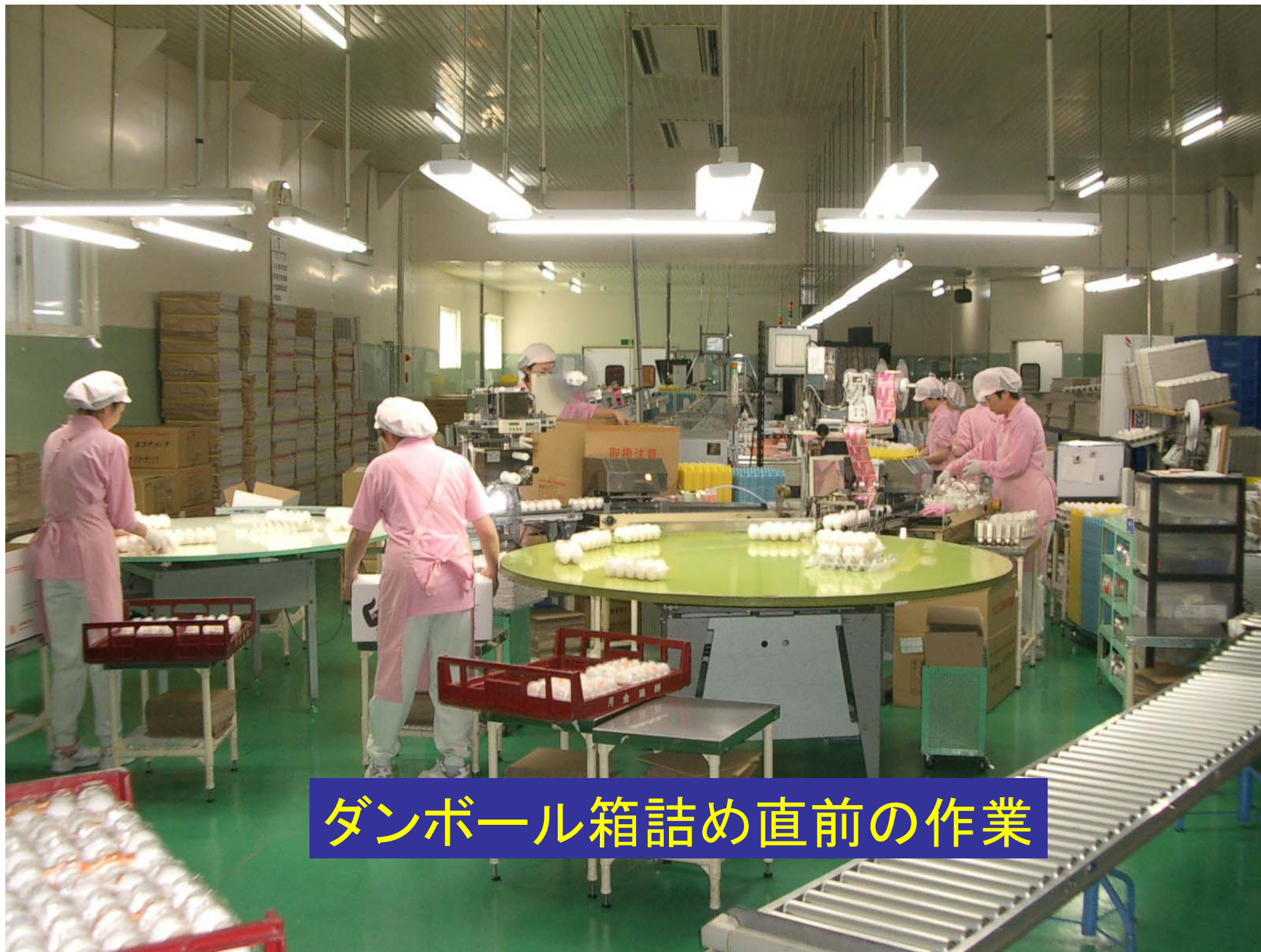
ダンボール箱詰め直前の作業