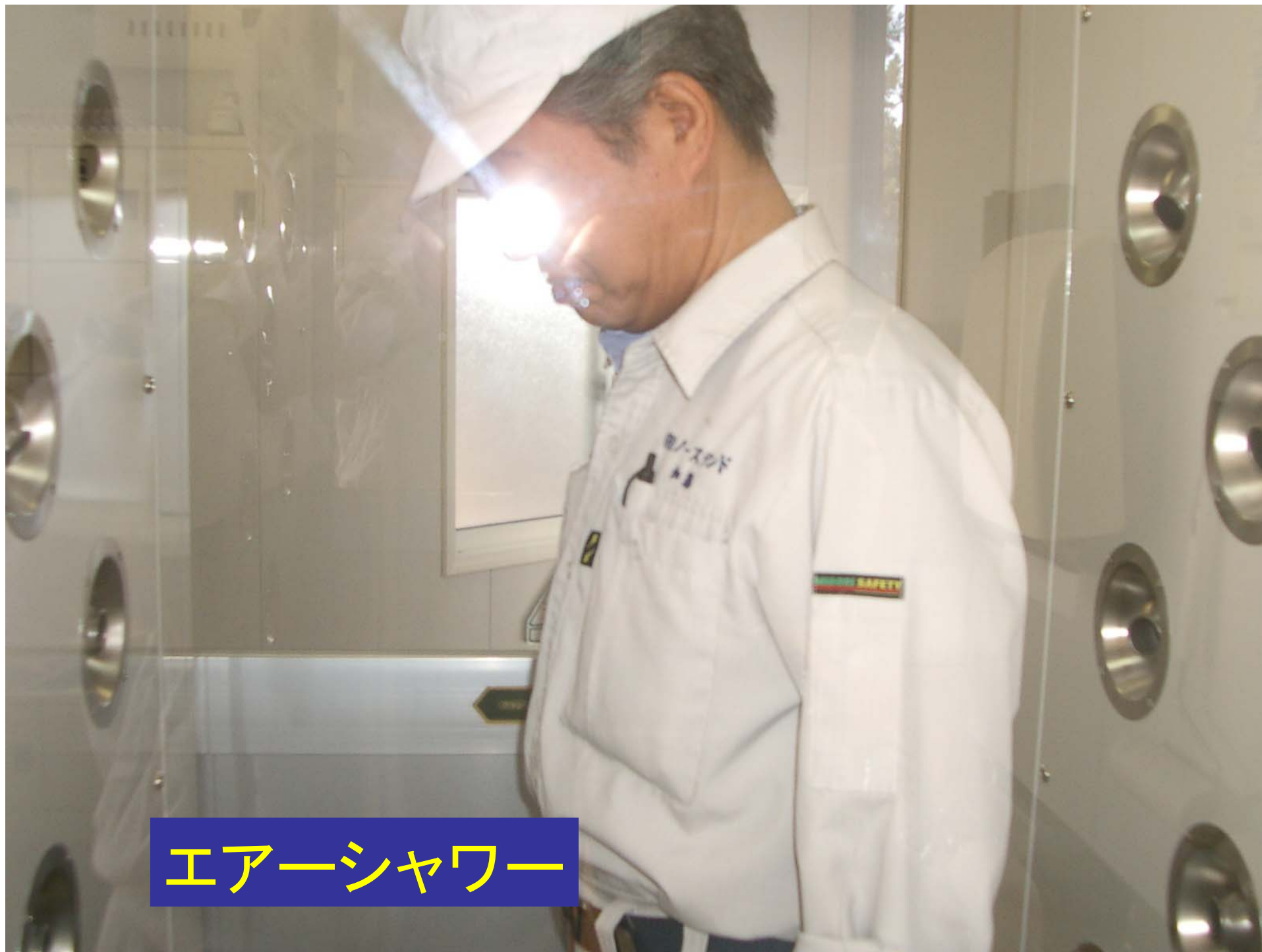
エアークシャワー