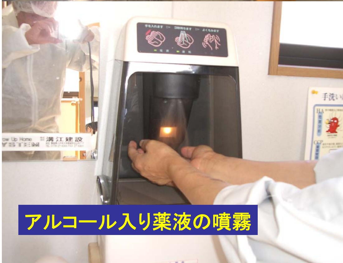
アルコール入り薬液の噴霧

お湯での洗浄、 薬液での洗浄、 ペーパータオルで拭き取り (省略) アルコール入り薬液の噴霧