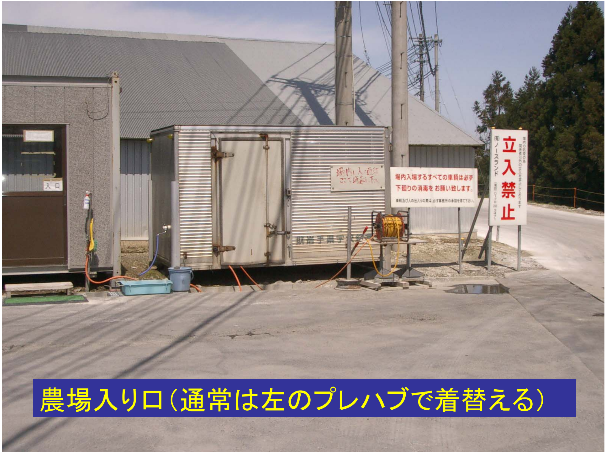
農場入り口(通常は左のプレハブで着替える)