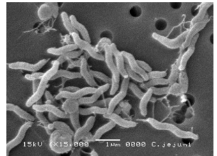
電子顕微鏡写真。〈食品安全委員会事務局資料〉

カンピロバクターに汚染された食品や水道水・井戸水から直接、または、汚染された食品の調理に用いた器具等からの二次汚染を介して、カンピロバクターを摂取することによってヒトが感染することがあります 7) 。数 100 個程度の少ない菌量の摂取で感染することが知られています 7) 。ヒトからヒトへの感染はまれですが、母親から子供への感染事例や家族内感染の報告があります 1) 。