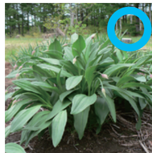
ギョウジャニンニク ※2