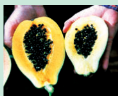
パパイヤ55-1(左)と非遺伝子組換えパパイヤ(右)。右はウイルスに感染したため大きくならなかった。

果実の主要構成成分は86%が水分で、他にタンパク質、脂質、灰分、炭水化物を含む。