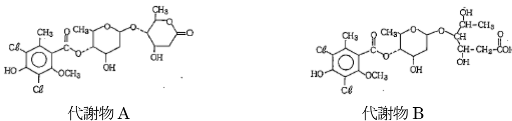
図 2 代謝物 A 及び B の構造式