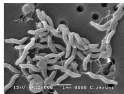
電子顕微鏡写真。

カンピロバクターに汚染された食品や水道水・井戸水から直接、または、汚染された食品の調理に用いた器具等からの二次汚染を介して、カンピロバクターを摂取することによってヒトが感染することがあります 9) 。100 個程度の少ない菌量の摂取で感染することが知られています 8) 。ヒトからヒトへの感染はまれですが、母親から子供への感染事例や家族内感染の報告があります 1) 。