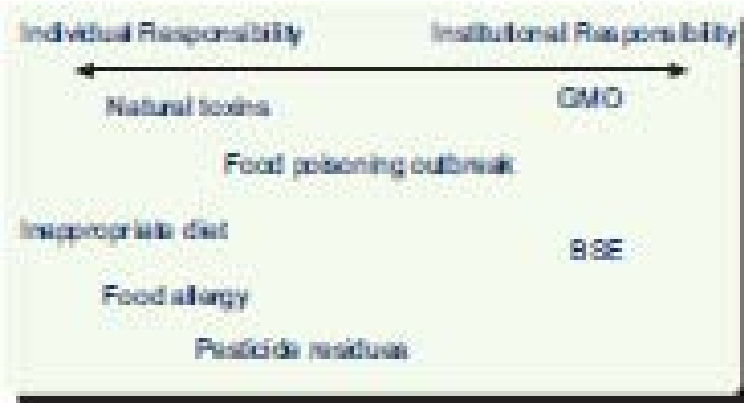
図1 個人と組織の間の責任関係についての認識